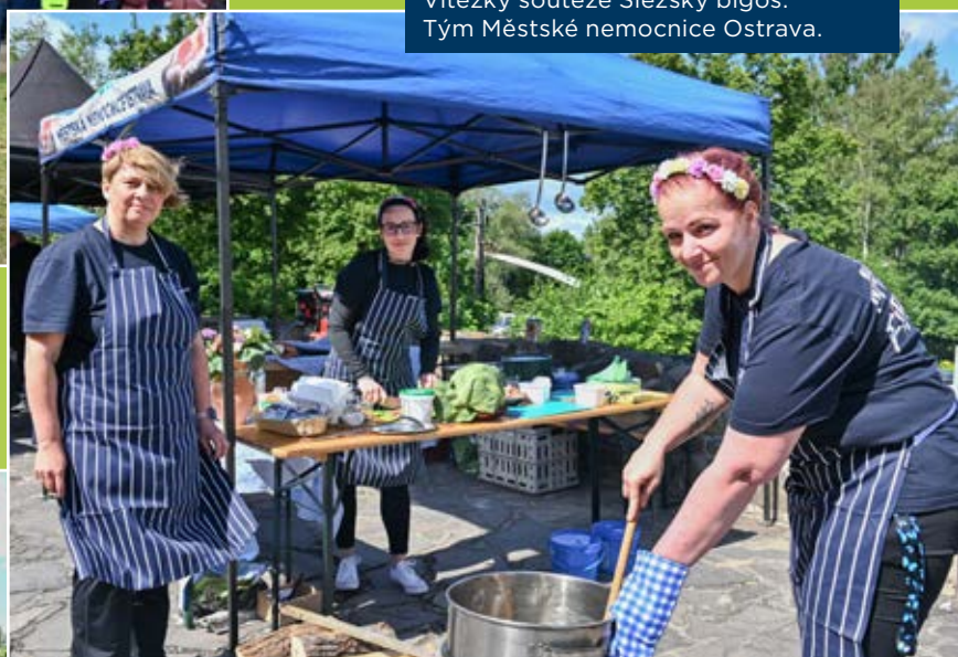
Vítězky soutěže Slezský bigos. Tým Městské nemocnice Ostrava.