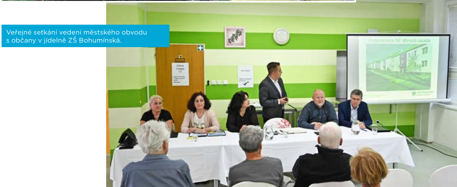
Veřejné setkání vedení městského obvodu s občany v jídelně ZŠ Bohumínská.