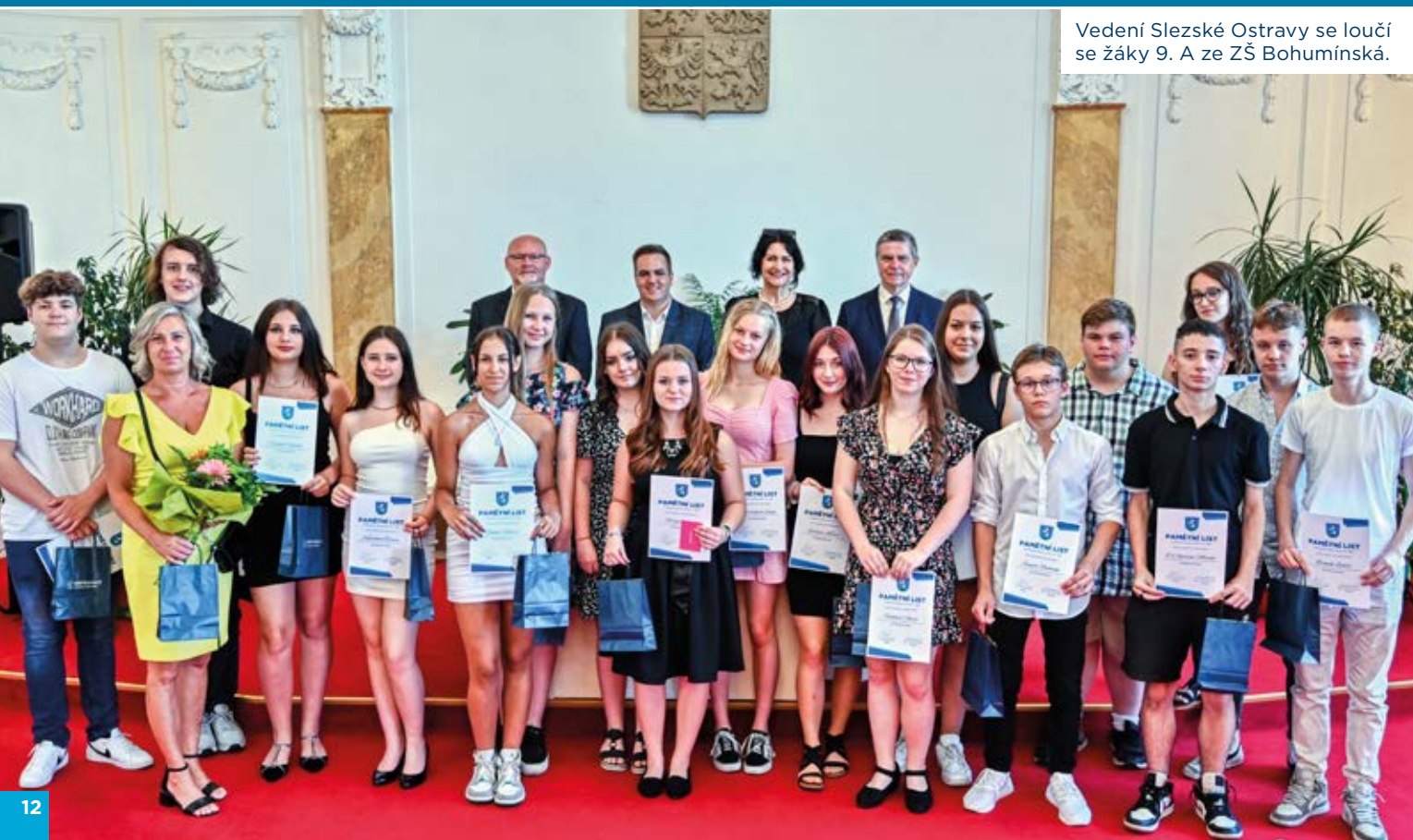
Vedení Slezské Ostravy se loučí se žáky 9. A ze ZŠ Bohumínská.