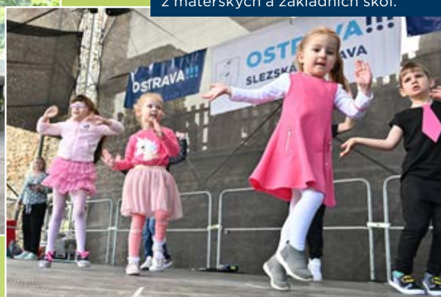
Dopoledne patřilo vystoupením dětí z mateřských a základních škol.