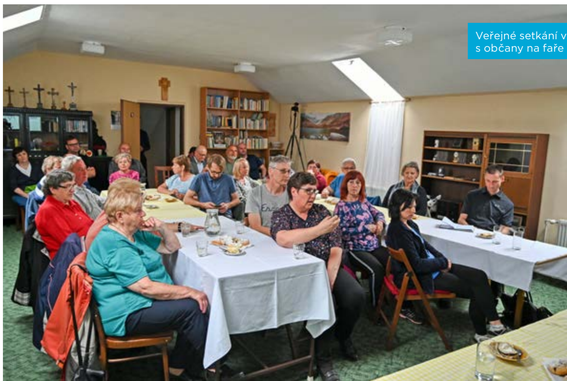
Veřejné setkání vedení městského obvodu s občany na faře v Heřmanicích.

V rámci diskuse se lidé zajímali o systém parkování pod estakádou Bazaly, zástavbu lokality Záměstí a vznesen byl podnět na častější úklid podchodu pod ulicí Bohumínskou.