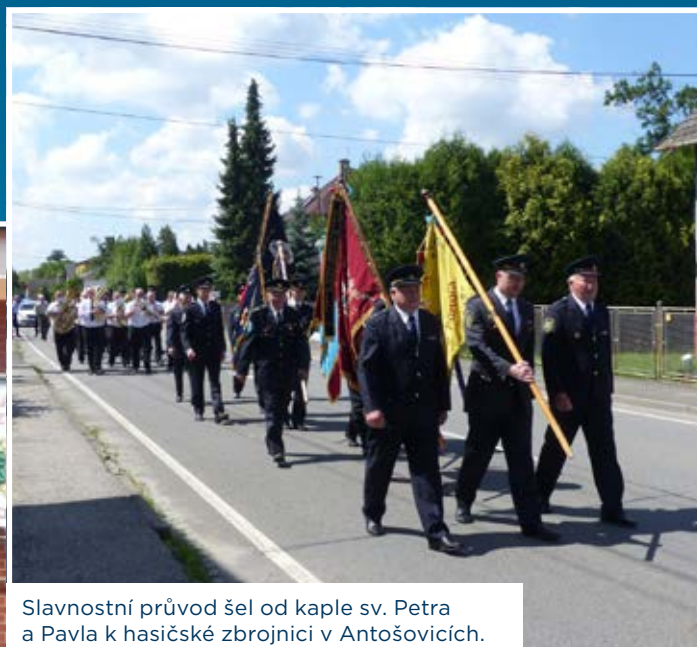
Slavnostní průvod šel od kaple sv. Petra a Pavla k hasičské zbrojnici v Antošovicích.