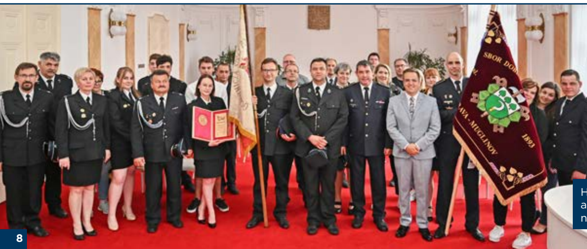
Hasiči z polského Grodziska a muglinovští hasiči během návštěvy slezskoostravské radnice.