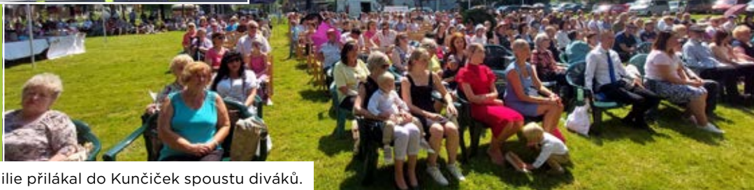
Zajímavý nedělní program Slezské lilie přilákal do Kunčiček spoustu diváků.